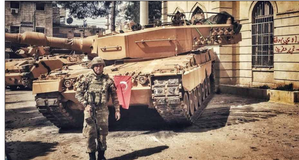
Türkische Armee mit deutschen Leopard 2-Panzern in Afrin

Seit dem Verlust seiner absoluten Mehrheit bei den Wahlen 2015 und dem Einzug der kurdischen HDP mit 12,7% ins türkische Parlament hat der Autokrat Erdogan den Friedensprozess mit den Kurd*innen aufgekündigt. Im Südosten des Landes wurde ein Krieg entfacht, der ganze Städte in Schutt und Asche legte.