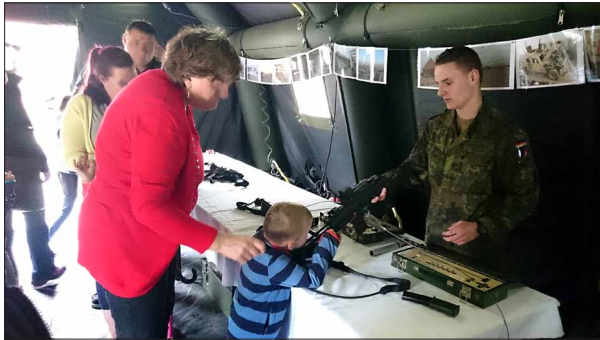
Tag der Bundeswehr in Stetten

Blanker Zynismus ist das Sammeln von Spenden für „Die Bundeswehr hilft Kindern weltweit“ - dort nämlich, wo sie im Einsatz ist. In Afghanistan warten heute noch zivile Opfer der von der Bundeswehr provozierten Einsätze auf eine angemessene Entschädigung für ihre verletzten und getöteten Angehörigen, darunter auch Kinder.