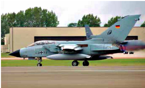
Einer der in Büchel stationierten Tornados, die ggf. US-Atomwaffen ins Ziel bringen würden.

Wegen der extrem kurzen Vorwarnzeiten beim Einsatz von Mittelstreckenraketen ist schon allein die Gefahr von Unfällen, von Missverständnissen und von versehentlich ausgelösten Kriegen extrem hoch.