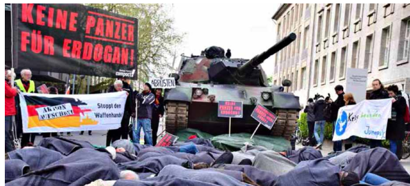
Proteste vor Rheinmetall Hauptversammlung 2017

Als NATO-Partner und Garant für die Blockade der Flüchtlingsroute drücken Medien und Politik in Deutschland beide Augen vor diesem Krieg zu. Ebenfalls bei dem Beschuss von kurdischen Stellungen in Syrien. Am 18. März 2018 besetzte die türkische Armee mit Hilfe deutscher Panzer und ihren verbündeten islamistischen Milizen die nordsyrische Stadt Afrin, die von Kurd*innen verwaltet wurde. Die meisten Kurd*innen flohen aus der Stadt. Seitdem schreitet die Türkisierung Afrins ungehindert fort, 2019 wurde sogar das Feiern des Neujahresfestes „Newroz“ verboten. Auch Jesid*innen, Armenier*innen und kurdische Christ*innen sind mittlerweile aus Afrin geflohen.